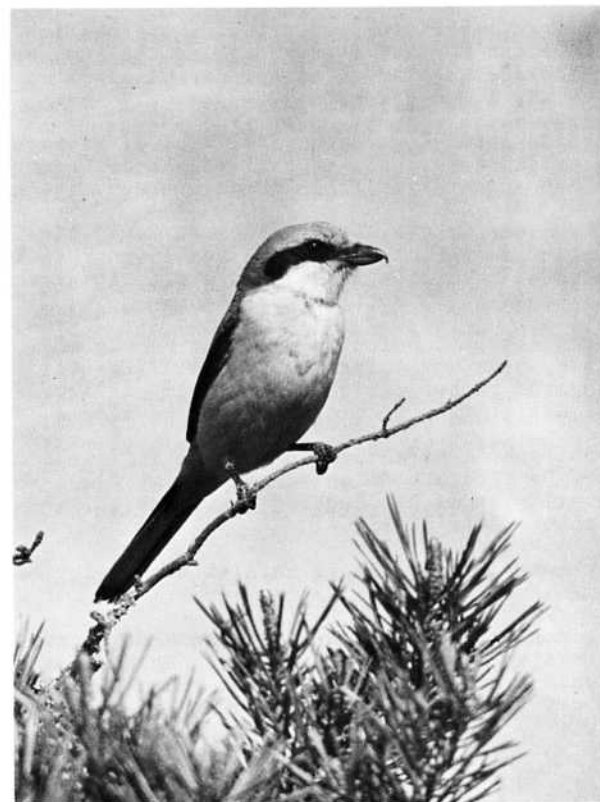
VARFÅGELN, en ganska vanlig vår- och höstgäst i Leksand.

Vi har bitt byggnadsnämnden att ordna en kvällstid för dem som ej kan komma loss under dagen. Vi har också bitt nämnden att annonsera visningstiden tydligare denna gång. Sen är det vår skyldighet att besöka utställningen, visa att vi verkligen är angelägna och lämna synpunkter på de olika alternativen.