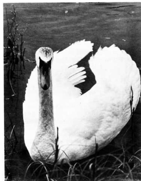
KNÖLSVAN I BYRVIKEN

Tyvärr är det många som tycker illa om de vackra svanarna. Tacka för det! De blir alltid närgångna när människor matat dem en tid. Slutar vi med denna onödiga utfodring, kan vi snart beskåda svanarna på lagom håll, när vi vill se dem.