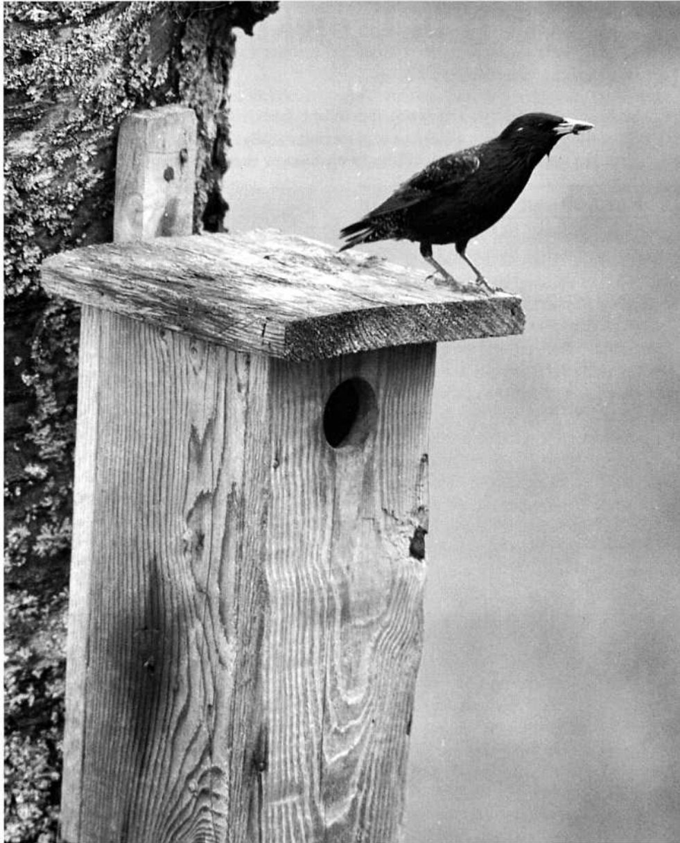
Staren är en av falkarnas favoritbyten