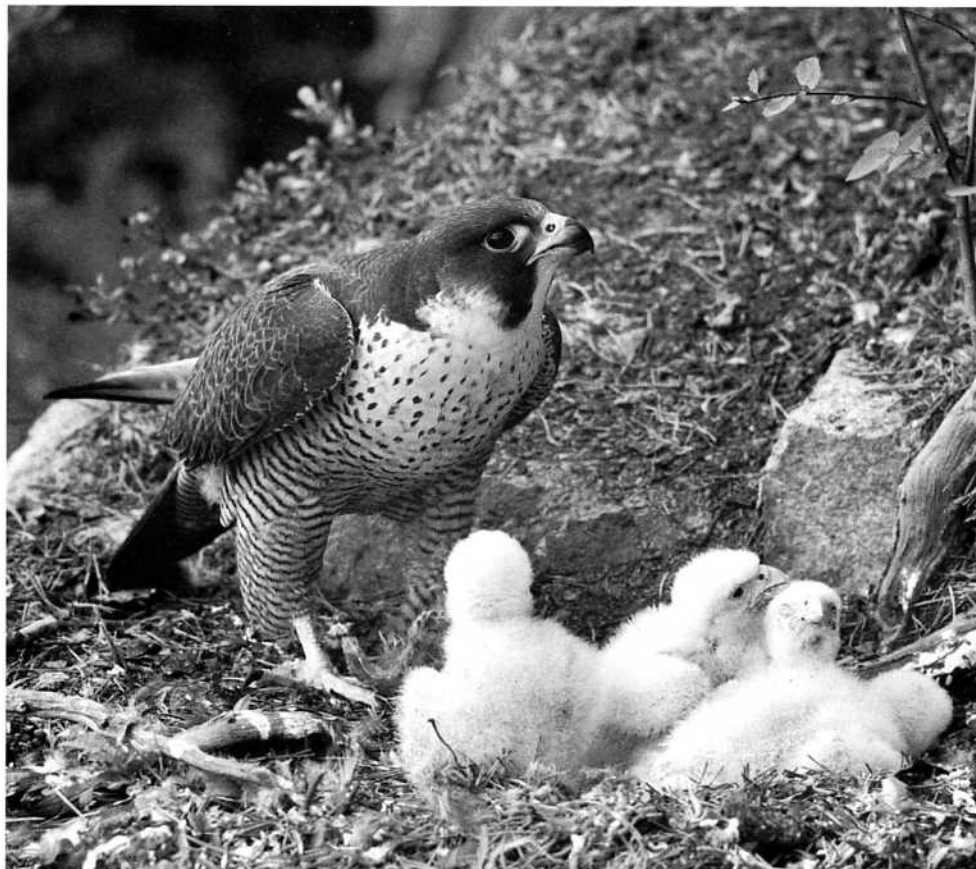
Skall vi äntligen återfå häckande pilgrimsfalkar i något av de gamla falkbergen

Fredagen den 22 september hittades Trull död i Kristinehamn. Vad som har hänt vet vi inte ännu, men han har skickats ner till falkcentralen för obduktion.