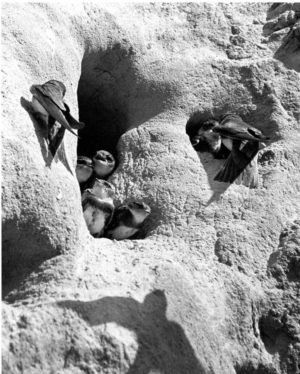
Dessa underbara backsvalor som trots allt haft ett ganska bra år 1995.