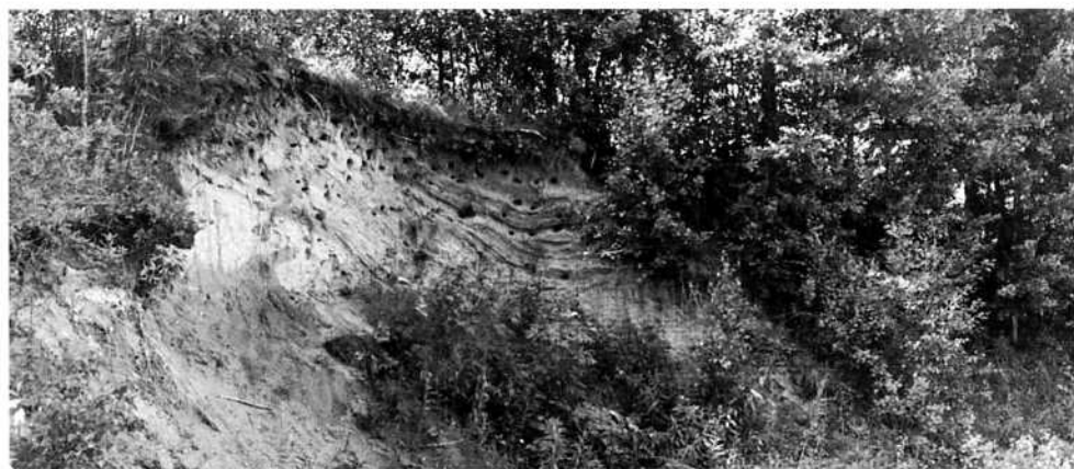
Backsvalans brant behöver röjas!