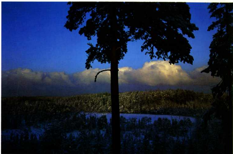
Solen orkar nästan inte över trädtopparna