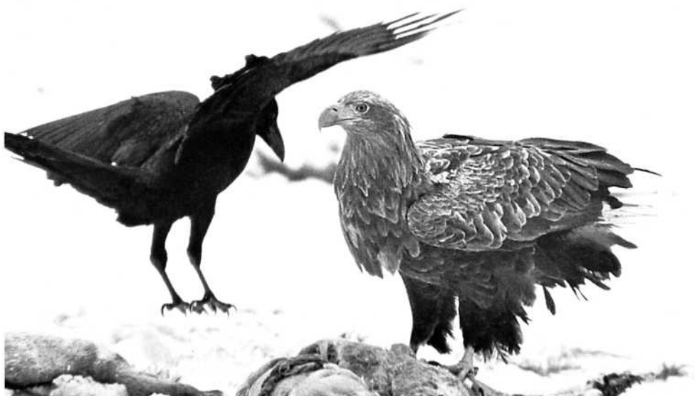
Havsörnen finns på vår åtel!