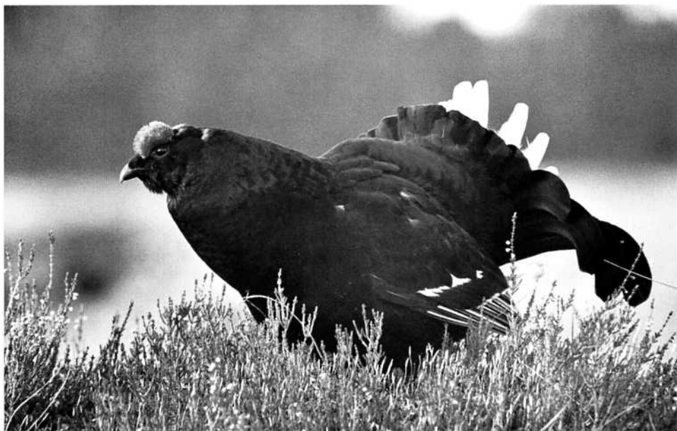
Välkommen med på orrspel i april!