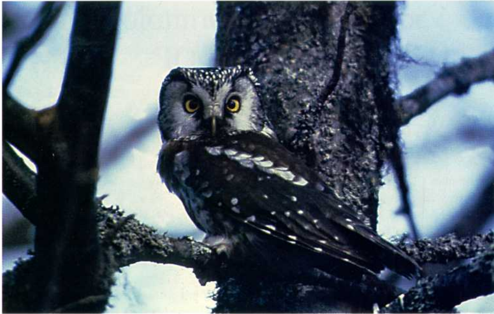
Gryssenstugan kommer att köpas av DOF och Leksands fågelklubb under vintern 1996. Pärlugglan blir närmsta granne!