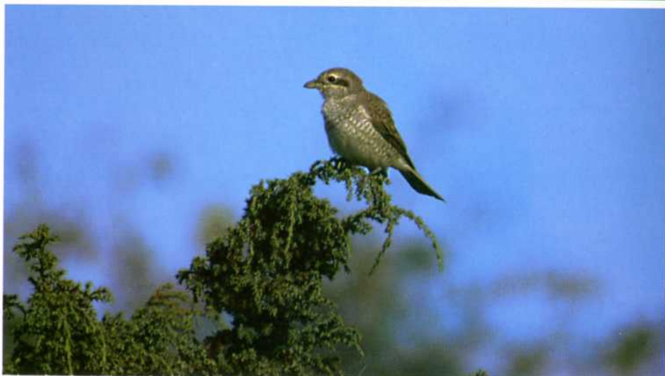
Törnskator. Övre bilden en hane, den undre visar en honfågel.