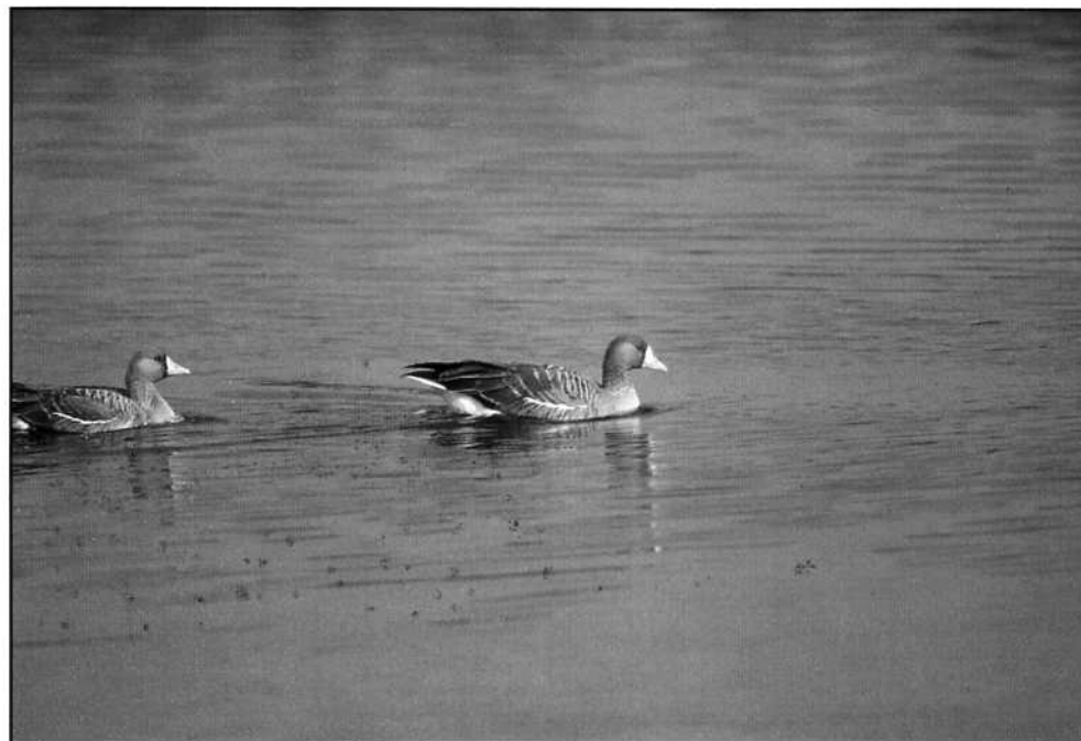
Bläsgås ( Anser albifrons ) gästade Leksand.

1 hane rastande 8/5. Olnäsviken, Siljansnäs sn. (Anders Hans). Leksands första, Dalarnas andra och landets 33:e