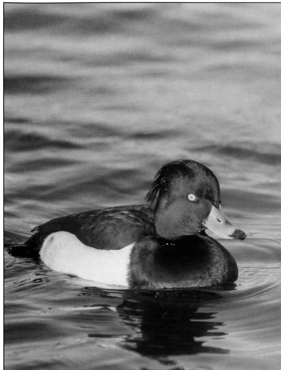
Vigghanne ( Aythya fuligula ).

Vi försöker bygga ett fågel/naturboksbibliotek i klubbstugan. Har Ni böcker eller tidskrifter som Ni kan undvara, tager vi tacksamt emot dessa. Kontakta någon av oss i styrelsen eller hälsa på vid något av våra månadsmöten dit alla Ni medlemmar alltid är välkomna till.