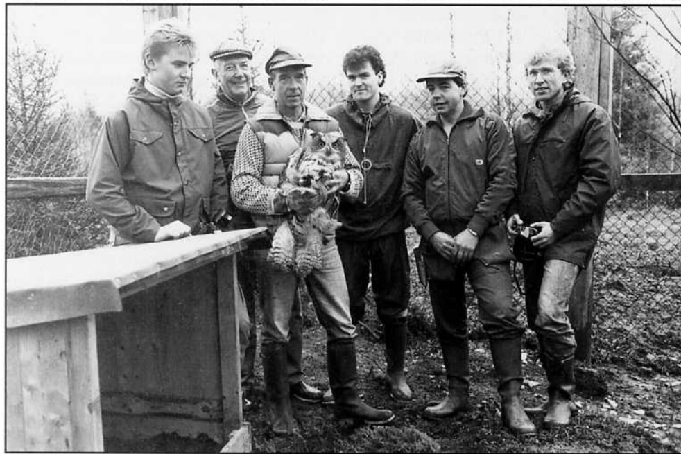
Idel unga män med Berguv ( Bubo bubo).