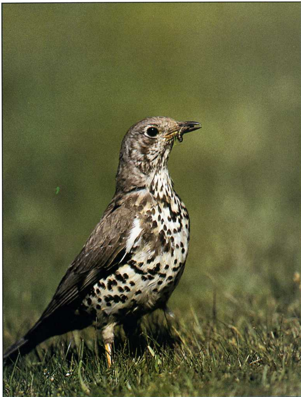
Dubbeltrast ( Turdus viscivorus ).