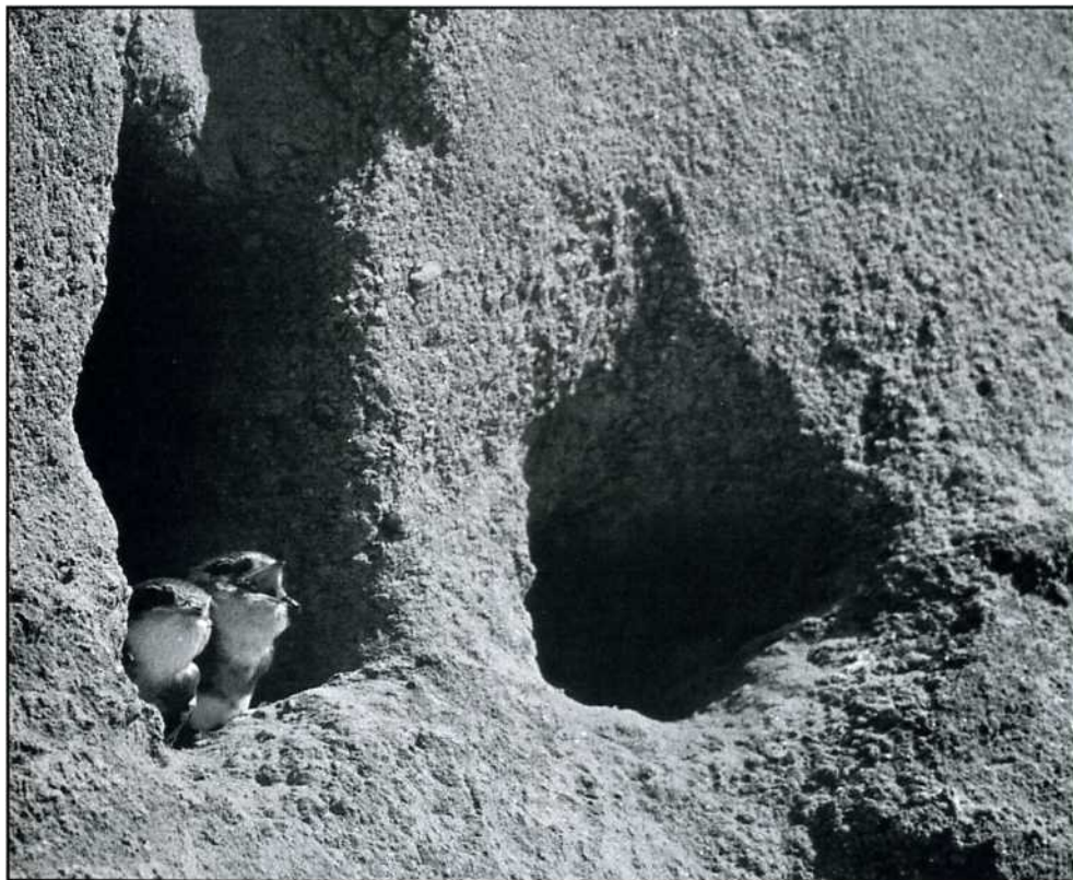
Backsvaleungar ( Riparia riparia ).

Dessutom känner vi till ytterligare en slagugglehäckning utom föreningens holkserie samt en häckning i en s.k "högstubbe".