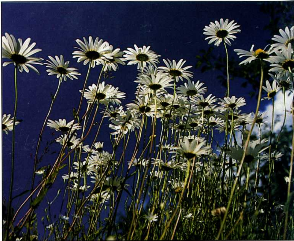
Prästkragar i sommarskrud.

Leksands Fågelklubb Arkivex. Sunnanäng 35 793 90 LEKSAND