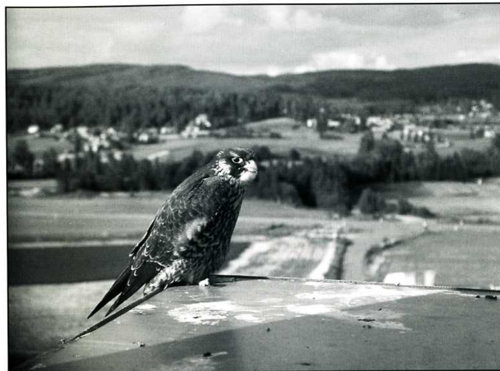
Pilgrimsfalk ( Falco peregrinus ) på Leksandsbröds silo.

fågelholkar. Endast 4 talgoxkullar, en blåmeskull samt 2 svart-vit flugsnapparkullar kontrollerades och ringmärktes. De holklevande fåglarna vid Limsjön är få, trots att såväl holkar som biotopen verkar vara mycket gynnsam för arterna.