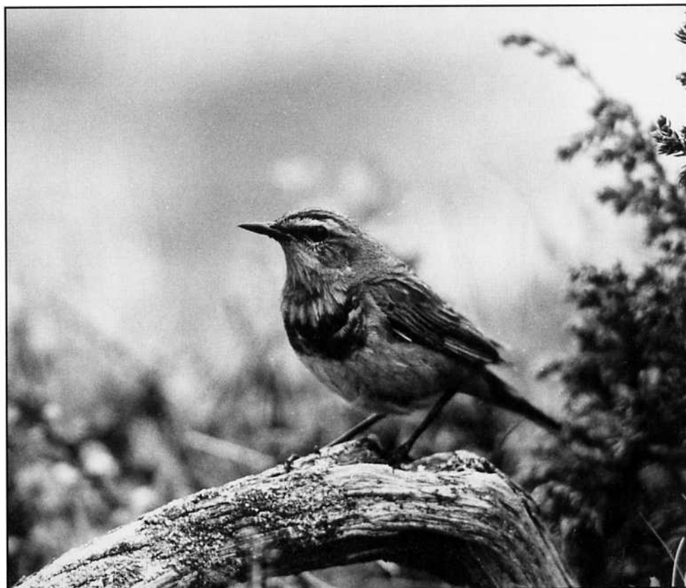
Blåhake ( Luscinia svecica).