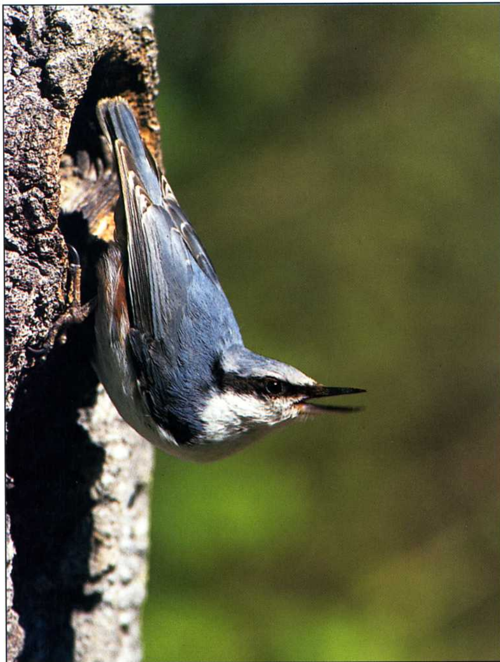
Nötväcka ( Sitta europea ).