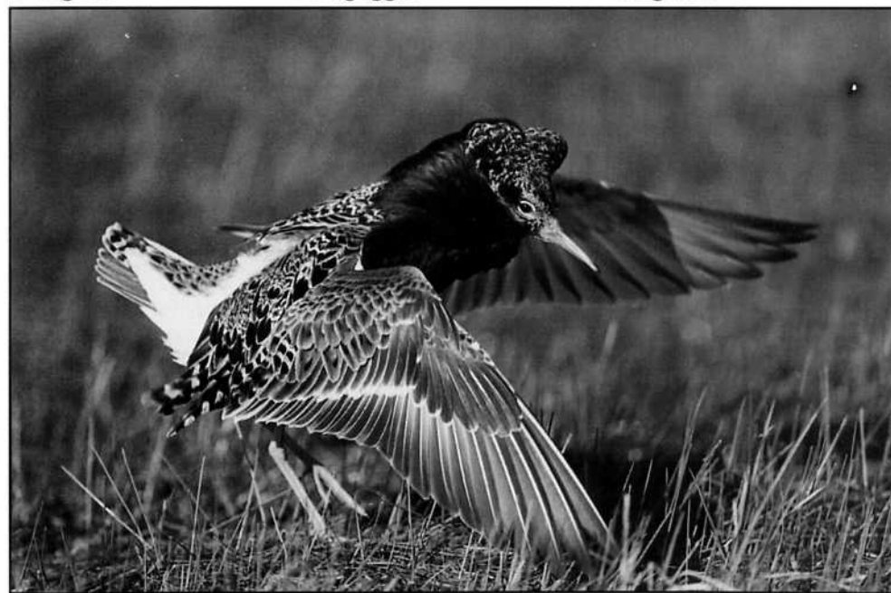
Spelande Brushane ( Philomachus pugnax ).