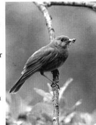
Näktergal, Luscinia luscinia.

Conny Land, rapportmottagare i Leksands kommun. Tel. 0247-22545 eller 070-2165555.