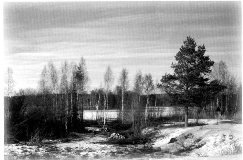
Vinterbild under inledande röjningsarbeten

Ett större sammanhängande madområde som håller på att förbuskas skulle kunna öppnas upp genom att endera gräva upp en vattenyta med ett djup på 0,5 meter med ett antal mindre öar för häckning, (där inte räven kan komma åt bona) eller så bygger man öar på befintlig mark sedan busken tagits bort och höjer sedan vattennivån i sjön till lämpligt djup.