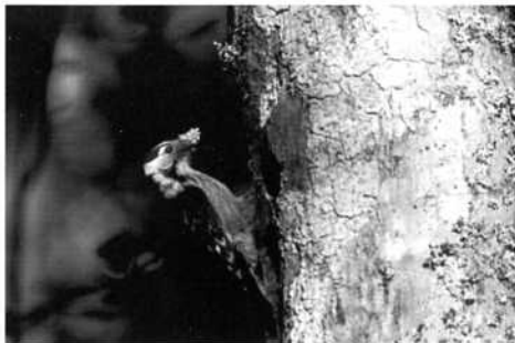
Mindre hackspett, Dendrocopos minor.

Jag själv upptäckte en sjungande trädlärka vid ridskolan i Insjön, detta var i början av maj. Tyvärr hade jag ej möjlighet att kolla eventuell