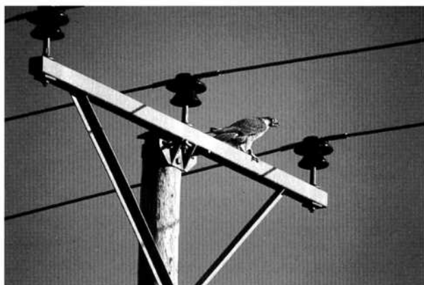
Många faror lurar för S7 innan det är dags för häckning!

Jag har regelbundet samlat in rester efter byten som slagits av S7. Dessa har främst