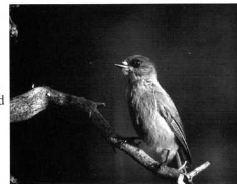
Lavskrika, Perisoreus infaustus.