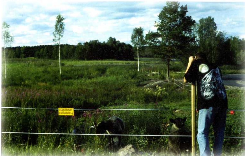
Sommarbild efter röjning med betande får

Genom att anlägga vandringsleder och ev. bygga flera fågeltorn kan området ytterligare höja sin status som ett nära natur och kultur område.