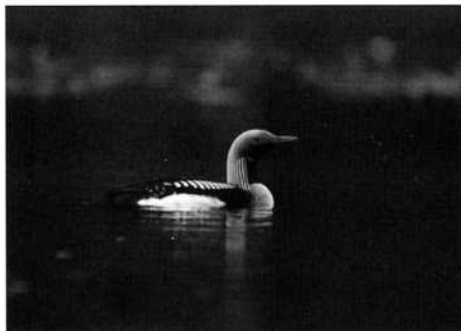
Storlom, Gavia arctica