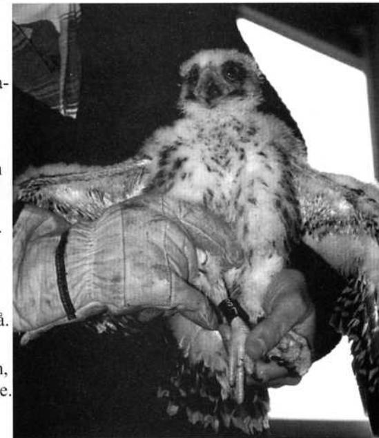
Selma som hackingfalk, 36-dagar gammal.

häckningssäsongen 1996 visade att de flesta av deras utflykter var riktade mot gamla häckningslokaler för pilgrimsfalk. Detta antydde att falkarnas utflykter kan ha varit rekognoseringsturer som förberedelse inför kommande eventuell häcknings-säsongs (Hake & Dahlgren 1997).