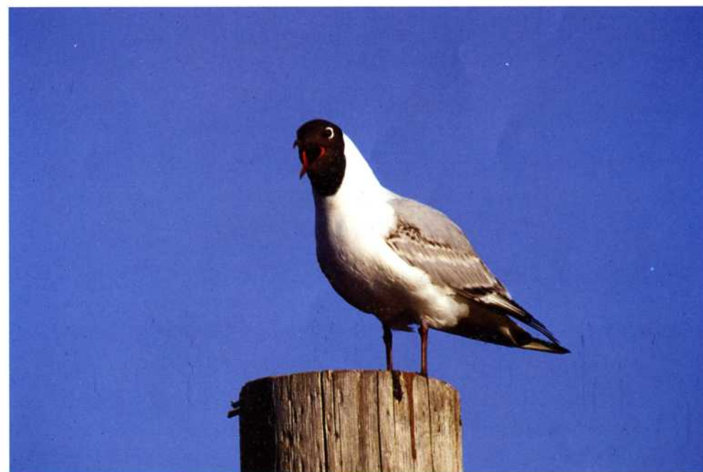
Skrattnås, Larus ridibundus

Det roligaste var att skrattnåsarna vid två tillfällen landade på taket och åkte snål-skjuts ute på sjön! När de skrek (två stycken var precis ovanför mina öron) var jag för att inte bli lomhörd tvungen att stoppa pekfingerarna i öronen. När jag killade en skrattnås under foten genom tyget, flyttade den sig bara några centimeter. Skrattnåsen på bilden är en av mina ljudliga fripassagerare som sedan landade på en stolpe. En morgon såg några morronpigga fågelskådare vid Norsbro en konstig farkost fara omkring i sjön med måsar på taket. Vilken syn det måste ha varit.