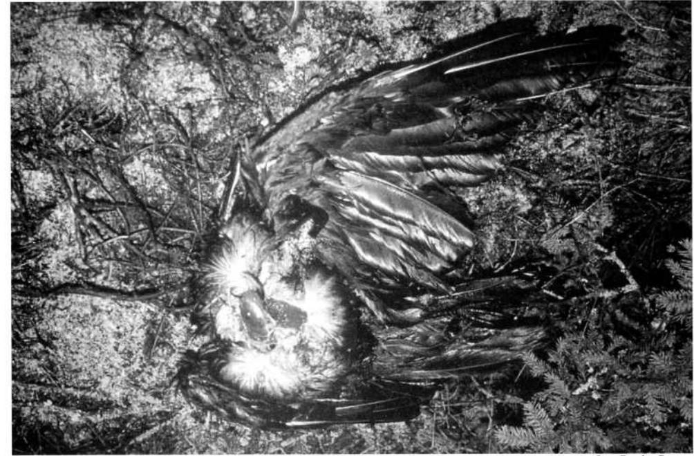
Örnen är skoningslös, en omtöcknad korp har inte chans.

Minuterna går medan mörkret tränger sig på allt mera. Korpen börjar se rätt så pigg ut, men den lever farligt nu. Om inte höken kommer tillbaka så finns det alltid en risk att någon örn dyker upp, tänker Henry och jag, 20-30 minuter har gått.