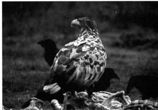
Havsörn, Haliaeetus albicilla

vinterns lopp är svårt att säga. Den slutliga granskningen av bildmaterialet är i skrivande stund inte genomförd.