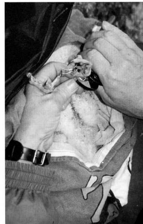
Ringmärkning av falkunge.

Som tack för rapporten får du all information om falken.